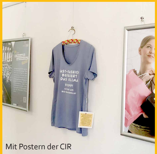
Mit Postern der CIR

Mit Kleiderbügeln im Innenraum an Bilderhaken leicht aufzuhängen.